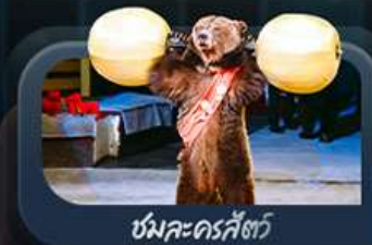
ชมละครสัตว์