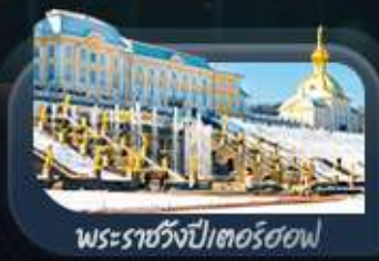
พระราชวังปีเตอร์ฮอฟ