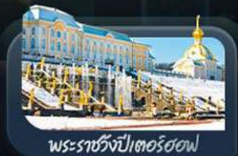
พระราชวังปีเตอร์ฮอฟ