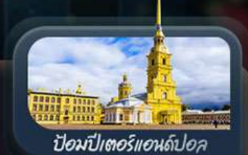
ป้อมปีเตอร์แอนด์ปอล

ไฮไลท์ สองเมืองไฮไลท์ของรัสเซียที่ไม่ควรพลาด! ตื่นตาตื่นใจกับมหาวิหารเซนต์บาซิล ชมความยิ่งใหญ่ของจัตุรัสแดง สัมผัสอดีตที่พระราชวังเครมลิน ชมความงามของสถานีรถไฟใต้ดินมอสโก ชาร์กอร์ส โบสถ์ไอสิกรินดี เป็นเขาสเปร์โรว์ให้คุณได้สัมผัส ชมความงามพระราชวังฤดูหนาว พิพิธภัณฑ์ฮอร์มิงทง ป้อมปีเตอร์แอนด์ปอล และมหาวิหารเซนต์ไอแซค