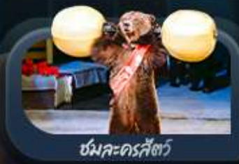
ชมละครสัตว์

highlight สองเมืองไฮไลท์ของรัสเซียที่ไม่ควรพลาด! ตื่นตาตื่นใจกับมหาวิหารเซนต์บาซิล ชมความยิ่งใหญ่ของจัตุรัสแดง สัมผัสอดีตที่พระราชวังเครมลิน ชมความงามของสถานีรถไฟใต้ดิน มอสโก ชาร์กอร์ส โบสถ์ไอสิกริบดี เป็นเขาสเปร์โรว์ให้คุณได้สัมผัส ชมความงามพระราชวังฤดูหนาว พิพิธภัณฑ์เฮอริตเทจ ปีอปปิเตอร์แอนดร์ปอล และมหาวิหารเซนต์ไอแซค