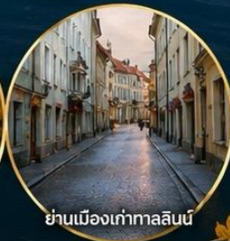
ย่านเมืองเก่าทาลลินน์