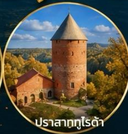
ปราสาทกูโรต้า