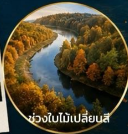
ช่วงใบไม้เปลี่ยนสี