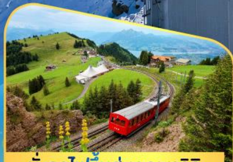
นั่งรถไฟขึ้นสู่ยอดเขาโรติก