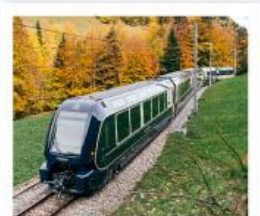
รถไฟโกลด์เดินพาส