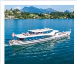
ส่งเรือทะเลสาบลูซีร์น