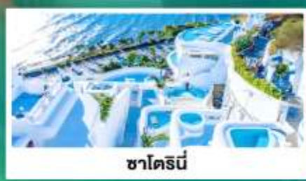
ซาโตรินี่