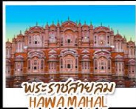
พระราชสาลอม HAWA MAHAL