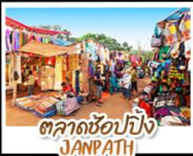
ตลาดช้อปปิ้ง JANPATH