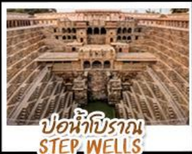
บ่อน้ำโบราณ STEP WELLS

ตลาดช้อปปิ้ง Janpath - พระราชสาลอม Hawa Mahal