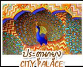
ประตูของ CITY PALACE