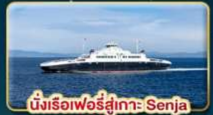
นั่งเรือเฟอร์รี่สู่เกาะ Senja