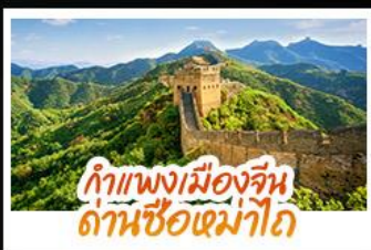
กำแพงเมืองจีน ด่านซือหม่าโต