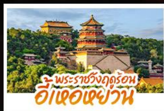
พระราชวังฤดูร้อน อี่เ้าอเฉยวัน