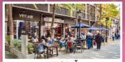
ชิวเกียนตี้