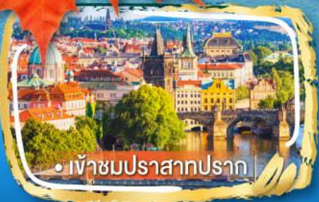
• เข้าชมปราสาทปราก