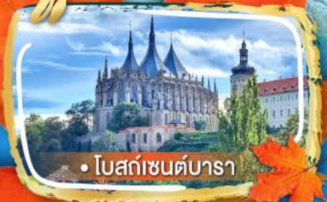
• โบสถ์เซนต์บารา

06-13, 09-16 ต.ค. 69 29 พ.ย. - 06 ธ.ค. 69 05-12 ธ.ค. 69 28 ธ.ค. - 04 ม.ค. 70