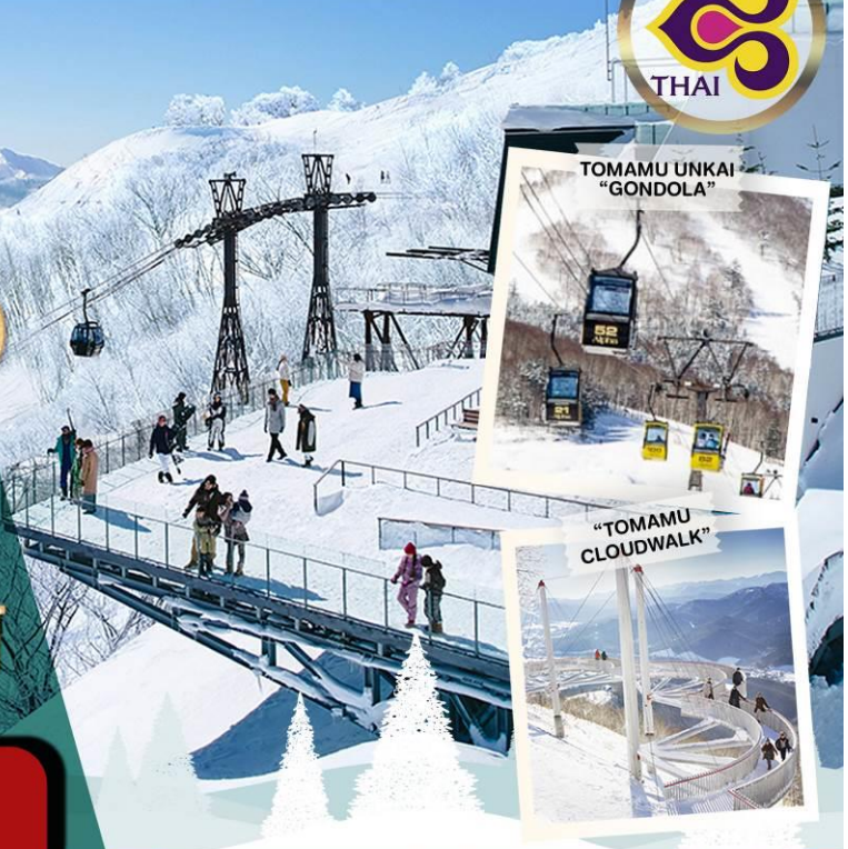
TOMAMU UNKAI "GONDOLA"