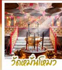
วัดเขม่านโหมว