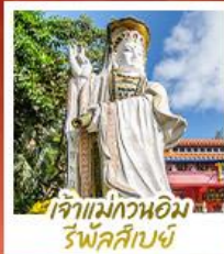
เจ้าแม่กวางหอม รพีลาลัย