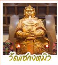
วัดเขกงเมิว