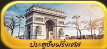
ประตูชัยฝรั่งเศส