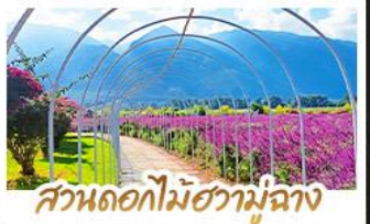
สวนดอกไม้ฮามูฉาง