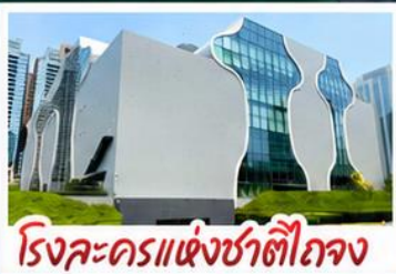
โรจละครแห่งชาติไทจง