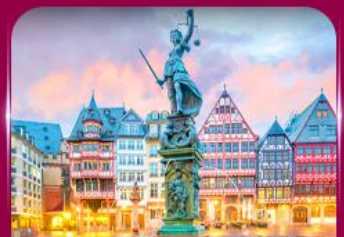
จัตุรัสโรเมอร์ ปรากกัฟิเรต