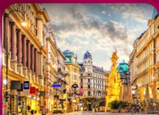
ชมเมืองโรมันติก เวียนนา