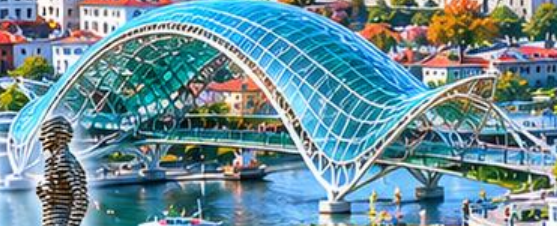
BRIDGE OF PEACE สะพานสันติภาพ