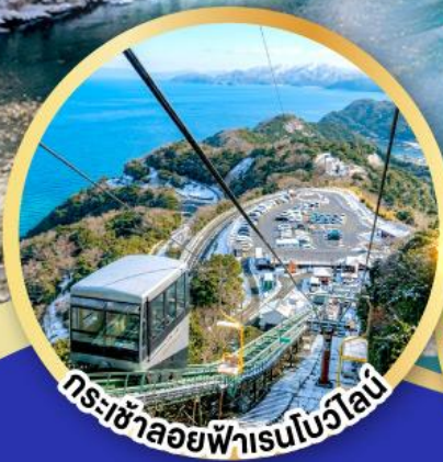
กระเช้าลอยฟ้าสวนสาธารณะ เรนโบว์ไลน์