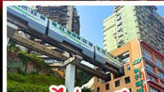
รถไฟทะลุคด