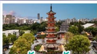
วัดเลงเซ้ง