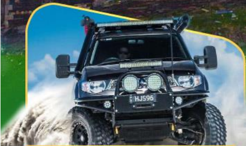
คันรถ 4WD สู้อีกกลางเทือกเขาคอเคซัส