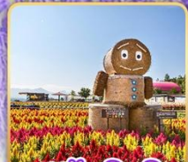
สวนซึกิไซโนะโอะกะ