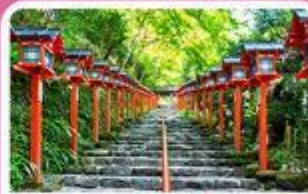
ศาลเจ้าคิฟูเนะ