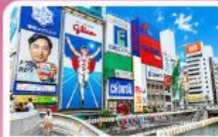
ชิบโซบาชิ