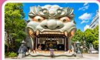
ศาลเจ้านิมมะ ยาชากะ