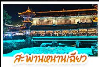
สะพานเสฉวนเฉียว