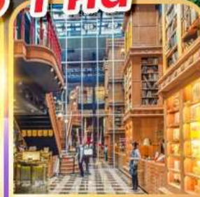
ร้านไอศกรีมมियाฮาร่า