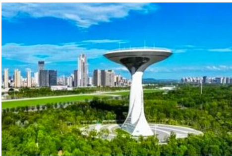
สวนสาธารณะลั่วกั๋ว

เช้า รับประทานอาหารเช้า ณ ห้องอาหารของโรงแรม (8)