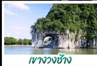
เขางวงช้าง