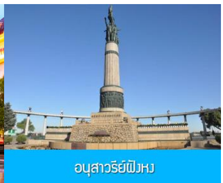
อนุสาวรีย์พังหง