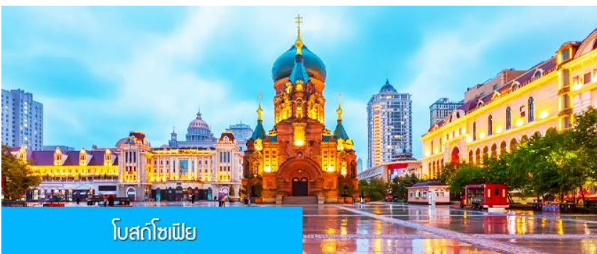
โบสถ์โซเฟีย