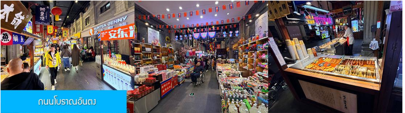
ถนนโบราณอันตง

จากนั้นนำท่านเที่ยวชม ถนนโบราณอันตง 安东老街 ถนนโบราณนี้เริ่มมีชื่อเสียงในฐานะเป็นย่านการค้าที่คึกคักที่สุดในใจกลางเมืองอันตง (ภายหลังได้เปลี่ยนชื่อเป็นต้นตง) ในปีค.ศ. 1876 ในสมัยราชวงศ์ชิง ปัจจุบันถนนสายนี้ยังคงไว้ซึ่งอาคารบ้านเรือนยุคเก่า(ราชวงศ์ชิง) และอบอวลด้วยวัฒนธรรมพื้นเมืองโบราณ ท่านจะได้สัมผัสการละเล่นและการแสดงพื้นเมือง ร้านค้าจำหน่ายของที่ระลึก ร้านอาหารท้องถิ่น และสตรีทฟู้ด ฯลฯ