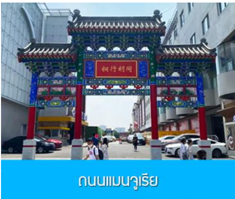
ถนนแมนจูเรีย