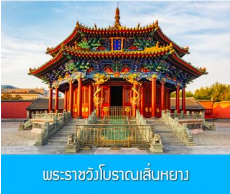
พระราชวังโบราณเสียนหยาง

รับประทานอาหารเช้า ณ ห้องอาหารของโรงแรม (1)