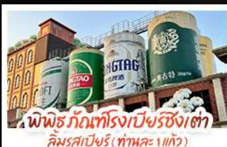
พิพิธภัณฑ์โรงเบียร์ชิงเต่า คิมรสเบียร์ (ทานคะ 1 แก้ว)