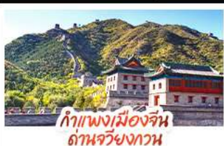
กำแพงเมืองจีน ด่านจวิ๋นกวาน

ห้องเรือสุดโรแมนติกแม่น้ำหวงผู้ ปักกิ่ง..เปิดประตูสู่แดนมังกร ด้วยความอลังการระดับจักรพรรดิ ชิงเต่า..เมืองชายทะเลสไตล์ยุโรป หรรษาแบบผ่อนคลาย เซี่ยงไฮ้..มหานครแห่งเอเชีย เมืองที่ไม่เคยหลับใหล