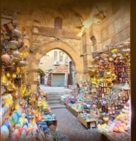
ตลาดงานเทศกาล