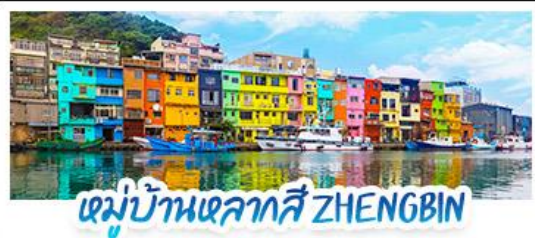
หมู่บ้านหลากสี ZHENGBIN