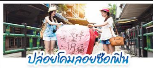
ปลั๊อโคมลอยซือเฟิน