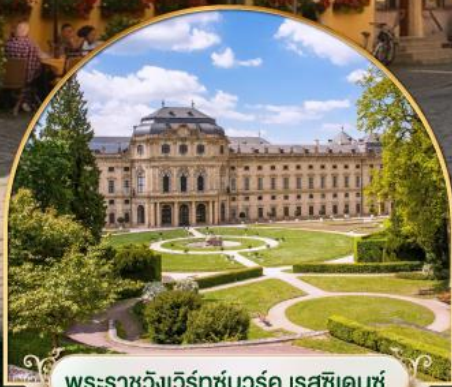
พระราชวังแวร์ซายส์ ฝรั่งเศส