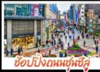
ซอปปิงกวมซุมซึ่