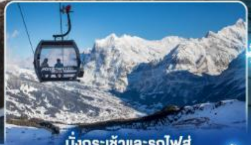
นั่งกระเช้าและรถไฟสู่ ยอดเขาจุงเฟรา