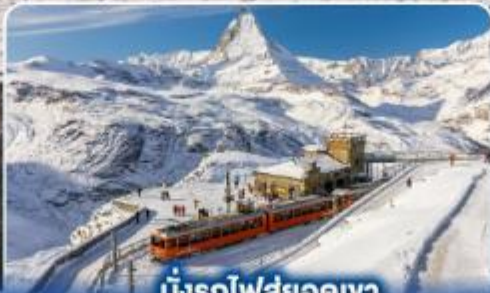
นั่งรถไฟสู่ยอดเขา กรอนเนอร์เกรต