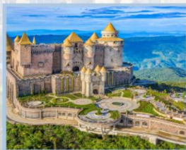
ปราสาทจันทร์