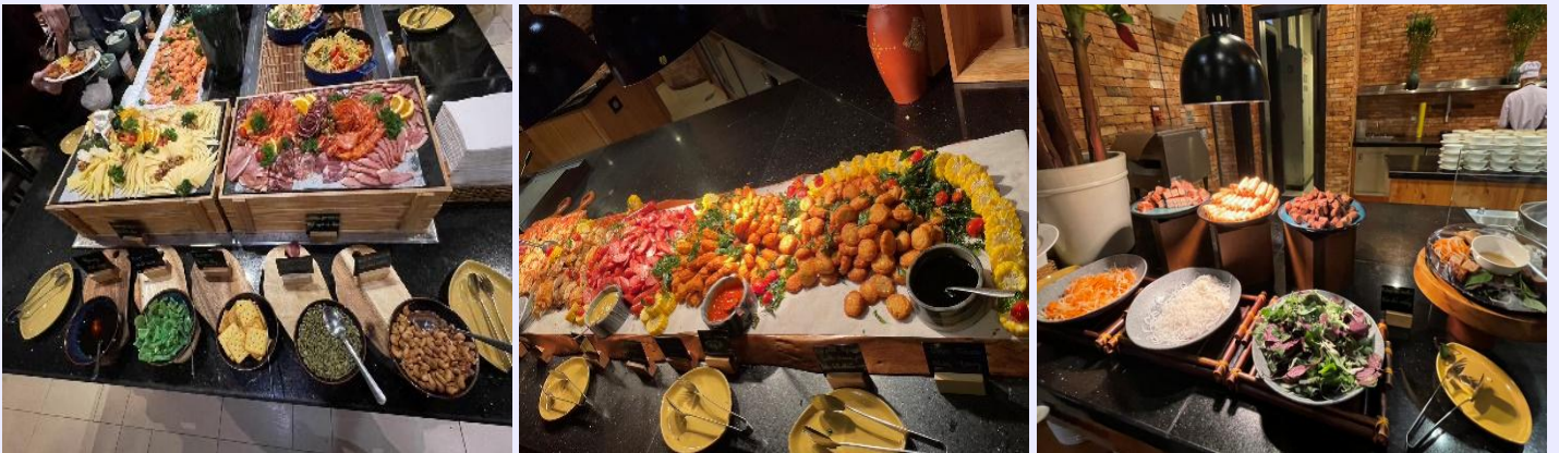
ที่พัก MERCURE DANANG FRENCH VILLAGE BANA HILLS HOTEL หรือเทียบเท่า ระดับ 4 ดาว

หมายเหตุ กรณีลูกค้าเดินทาง 3 ท่าน ห้องพักบนบานาฮิลล์ เป็นห้องแบบ FAMILY BUNK (เตียง 2 ชั้น 2 เตียง) โดยมีค่าใช้จ่ายเพิ่ม 1,500 บาท/ห้อง/คืน *** เนื่องจากห้องพักบนบานาฮิลล์ ไม่มีห้องพักบริการสำหรับ 3 ท่าน *** **สำหรับคืนที่พักบนบานาฮิลล์ โปรแกรมและคืนเข้าพัก อาจมีการปรับเปลี่ยนได้ ทั้งนี้ขึ้นอยู่กับจัดการของโรงแรม ทางบริษัทสามารถสลับปรับเปลี่ยนได้ตามความเหมาะสม โดยไม่ต้องแจ้งให้ทราบล่วงหน้า**