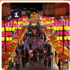
ตลาดกลางคีนซาโจว