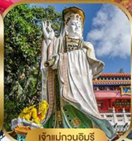
เจ้าแม่กวนอิม พลัสเบย์