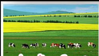
ทุ่งหญ้าเออร์ดอส

ทุ่งหญ้าเออร์ดอส สุสานเจกิสข่าน แกรนด์แคนยอนแม่น้ำเหลือง