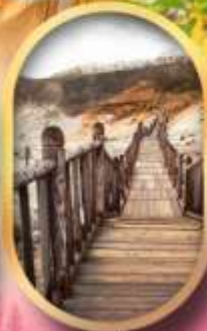
หุบเขาจิกุคาบิ