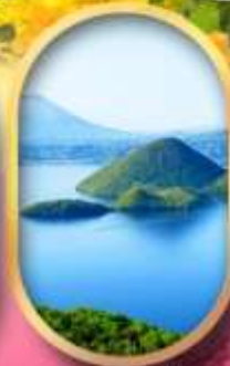
วิวทะเลสาบโทยะ