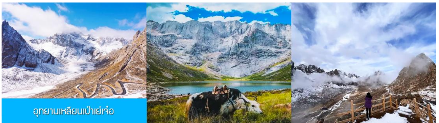
อุทยานเขลิยนเป่าเย่เจ้อ

พักที่ โรงแรม ZUNGE ZHUOYUE HOTEL ระดับ 4 ดาวท้องถิ่นหรือเทียบเท่าในอำเภออาป่า