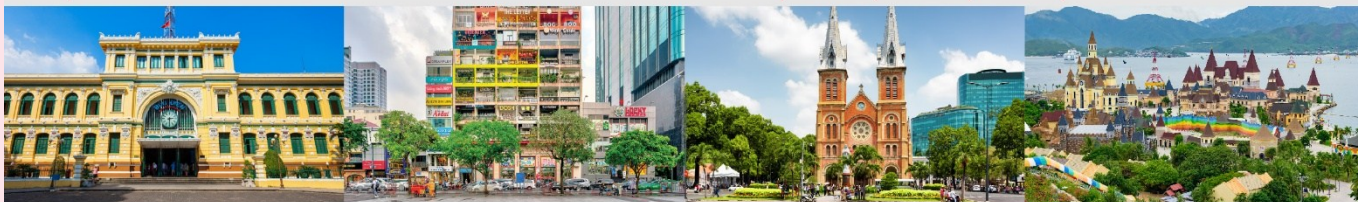
ไพรบ์นีย์กลางโฮจิมินห์