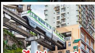
รถไฟไฟทะลุคอก