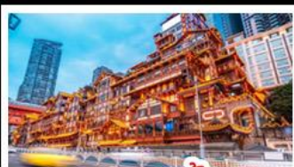
เฉิงเฉิงเฉิง

อุทยานหลุมบ่อฟ้า - อุทยานเจนางฟ้า หงหยาดัง - นังรถไฟทะลุคอก - อุทยานสีดรุณี ปี้เฉิงโกว - สะพานหนานเฉียว