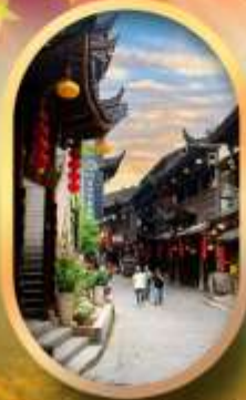
เมืองโบราณฟูหลงเจิน