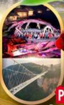
OPTION 1: ไร่ฉางผางจิ้งจอกขาว OPTION 2: สระพวยแก้วจางเจียเจีย