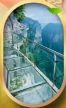
ทางเดินกระจกฉิมผา