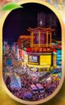
ถนนคนเดินซิงสุ