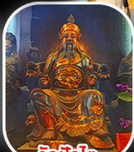
วัดปิกไต