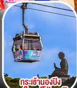
กระเช้าเองปีง พระใหญ่ไผ่หลิน