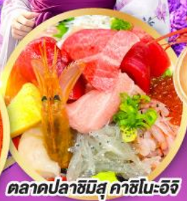
ตลาดปลาฮิมสุ คาชิโมะจิ