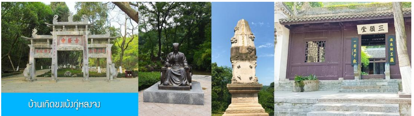
บ้านเกิดขงเบ้งกู่หลงจาง

พักที่ XIANGYANG MEIHAO HOTEL ระดับ 4 ดาวท้องถิ่นหรือเทียบเท่าในเมืองเซียงหยาง