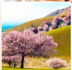
ทุ่งดอกอัลมอนต์