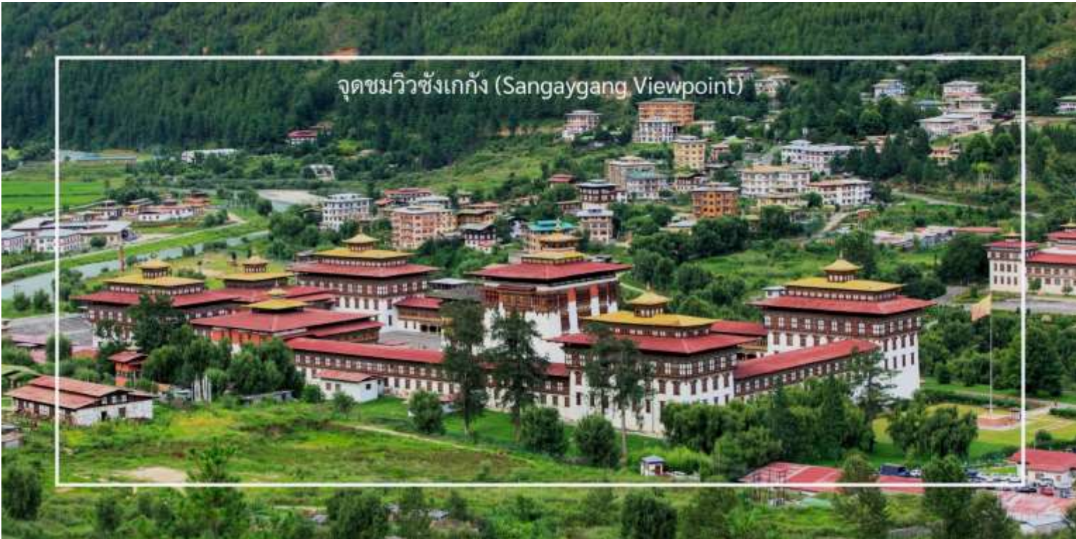
จุดชมวิวซังเกกัง (Sangaygang Viewpoint)

ออกเดินทางสู่เมืองพาโร โดยใช้เวลาเดินทางประมาณ 50 นาที