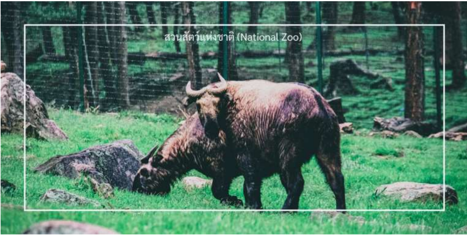
สวนสัตว์แห่งชาติ (National Zoo)

เที่ยวชม จุดชมวิวซังเกกัง (Sangaygang Viewpoint) เป็นหนึ่งในจุดชมวิวที่สวยงามในเมืองทิมพู (Thimphu) ตั้งอยู่บนเนินเขาที่สูง ทำให้ผู้เข้าชมสามารถมองเห็นทิวทัศน์ที่งดงามของเมืองทิมพูและภูเขารอบๆ จุดชมวิวนี้อมีทิวทัศน์ที่สวยงามของเมืองทิมพูและเทือกเขาหิมาลัย โดยเฉพาะในวันที่อากาศแจ่มใส นักท่องเที่ยวสามารถเห็นวิวที่กว้างไกลได้อย่างชัดเจน