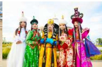
แต่งชุดพื้นเมืองบอโกล